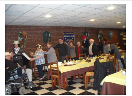
Après l'Assemblée Générale studieuse, c'était la fête, Samedi 15 janvier !