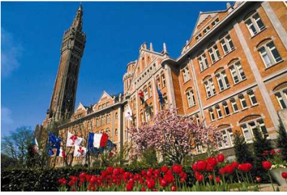
Hôtel de ville à Lille