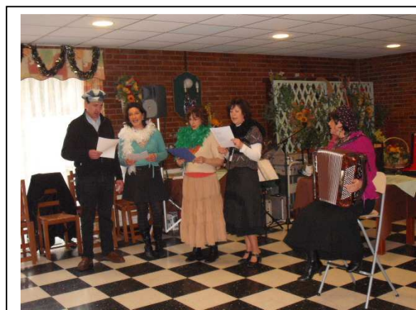
L'antenne de Cambrai.