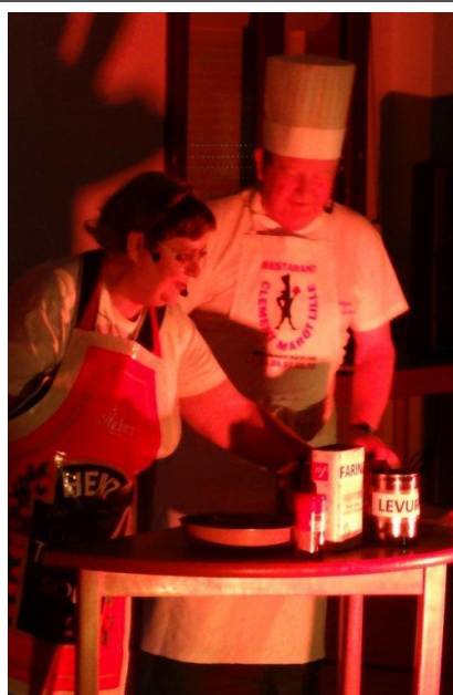
La cuisine des amoureux