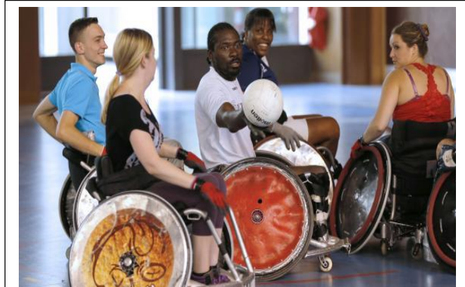
Les Mondiaux de rugby-fauteuil, discipline paralympique depuis Sydney en 2000, se dérouleront du 4 au 10 août 2014 au Danemark.