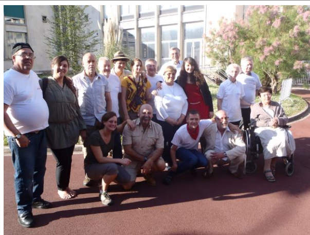
Les comédiens de « Voyage en Aphasie »

Un peu à la fois, nous nous sommes pris au jeu et avons trouvé du plaisir dans nos rencontres régulières à Raimbeaucourt, au centre Hélène Borel, qui avait mis à notre disposition une salle. Les exercices orthophoniques, de l'expression, du positionnement sur scène, se sont succédés.