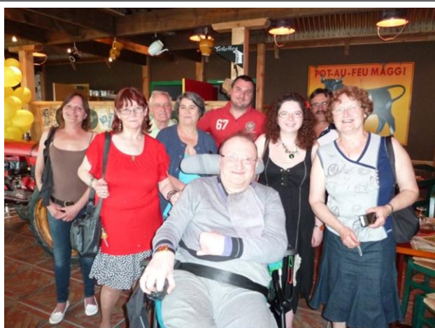
Antenne de Caudry