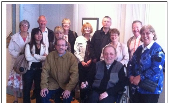
Le groupe des habitués de Bailleul !

Vers 13 heures, nous nous sommes retrouvés à l'auberge du Noormeulen où nous sommes accueillis par l'équipe en costume flamand dans une vieille ferme pour un repas typique (faluche casselloise, carbonnade flamande et frites, tatin à la rhubarbe) .Nous nous sommes quittés vers 15 h 30 en se donnant rendez-vous le lendemain pour RETRO'BELLES.