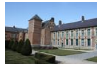
Chartreuse de Douai