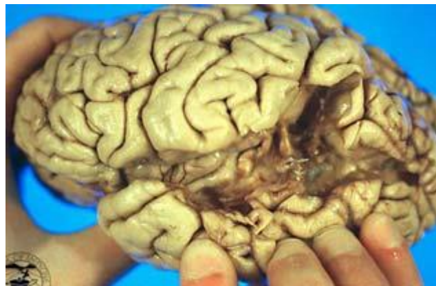
Un cerveau avec une lésion responsable d'une aphasie de Wernicke

Ces observations ont été maintes fois confirmées et l'on s'entend aujourd'hui sur le fait qu'il y a, autour du sillon latéral de l'hémisphère gauche, une sorte de boucle neurale impliquée dans la compréhension orale du langage et sa production par la parole. À l'extrémité frontale de cette boucle, on trouve l'aire de Broca ,