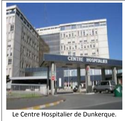
Le Centre Hospitalier de Dunkerque.

On a été sur place pendant le carnaval. Si vous voulez savoir ce que sont le « beste clet'che » et la cantate à Jean Bart, vous faites www.youtube.com/watch?v=C9oE3ndBM00 sur l'ordinateur. C'est l'âme des Dunkerquois, ou assimilés !