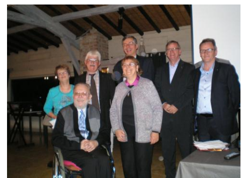
Les rotariens Bailleul Yser-Lys font un don de 2000 € aux aphasiques du Nord