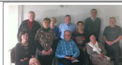
Le congrès de la FNAF se précise ! Voilà une photo qui le prouve !