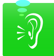
Plate forme répit Centre Hélène Borel